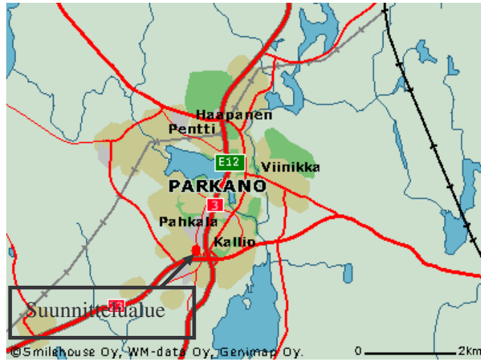
Kuva 1. Lähestymiskartta