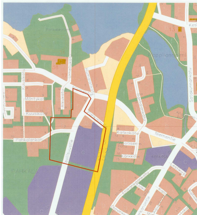
Kuva 1. Lähestymiskartta