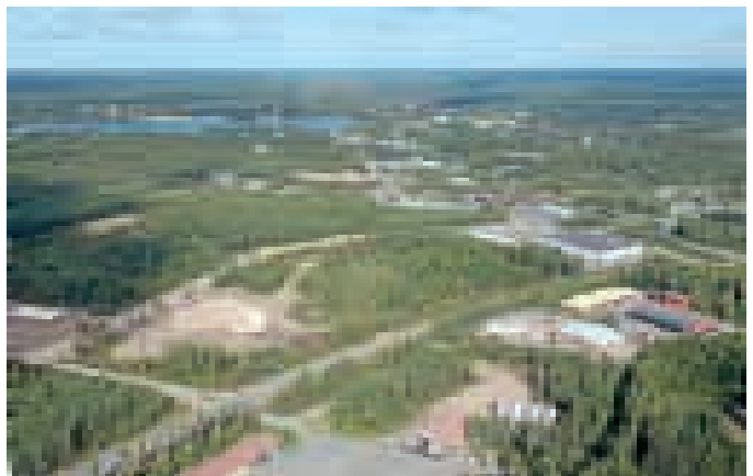
Paloasema rakennetaan Fennokadun varteen, kuvassa hiekka-alueena näkyvälle tontille.