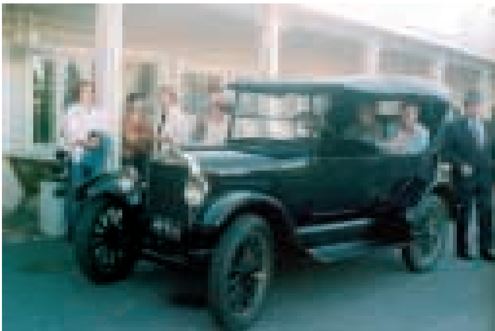
Raili Lehtimäki teki viimeisen työpäivänsä kunniaksi komealla kulkupelillä muistelumatkan vanhalle vanhainkodille.