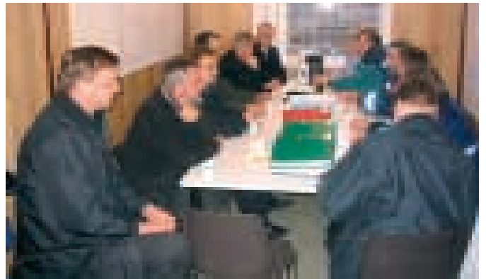
Paloaseman urakkasopimuksia allekirjoittamassa.

Alueelle sijoittuu myös ensi vuoden merkittävin kadunrakennushanke eli Yrittäjäkadun rakentaminen.