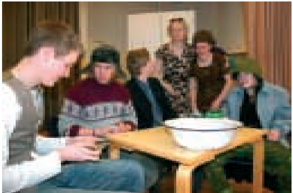
Lukion musiikkiteatterilinja on jo seitsemättä kertaa mukana Art Festivossa uudella produktiolla. Tällä kertaa nähdään rehvakasta eloa Beetlehem-nimisellä kirpputorilla.

– Musiikkikomedialla kannattaa tulla katsomaan, koska siinä on loistava käsikirjoitus, mahtavia näyttelijöitä ja muhevia, komediallisia rooleja.